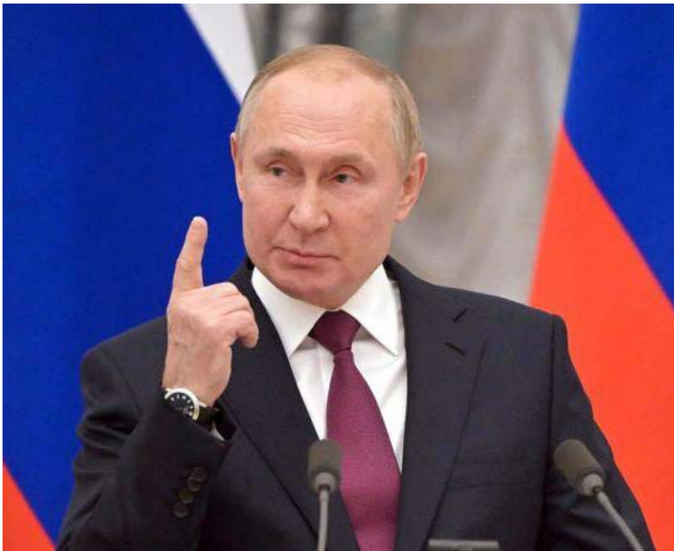
Ifølge den britiske Ruslands-ekspert Keir Giles går Putin styrket ud af Ukraine-konflikten.&nbsp;Foto: Mikhail Klimentyev/AFP/Ritzau Scanpix.

De mål, Putin allerede har nået, er, fortsætter han, »at få USA og andre vestlige ledere til forhandlingsbordet og at sætte østeuropæiske landes suverænitet på agendaen - som noget, der skal diskuteres mellem Rusland og Vesten. Det samme gælder NATOs beskyttelse af disse lande. Det ville aldrig tidligere have været et emne, der overhovedet blev diskuteret. Det her er en kæmpe strategisk sejr til Rusland.«